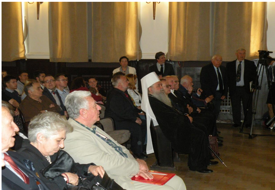
Част от официалните гости на събитието, Големия салон на БАН, 10.05.2018.